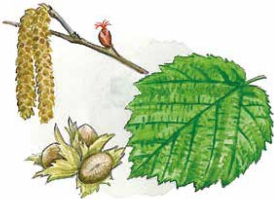
Hassel Corylus avellana av Nils Forshed

LINNAEUS BUILT UP a system of eight "excursions," educational nature walks, around Uppsala, and called them Herbationes Upsalienses. "Herbationes" comes from Latin and means botanical walks. Seven of the excursions started at the town boundaries and an eighth took place in the village of Jumkil. The excursions represented the last lectures of the spring term.